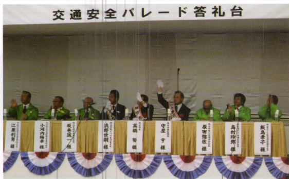
交通安全パレード答礼台

安全パレードでは、71 名の参加の下、横断幕「輝けシルバー」を先頭に、のぼり旗を掲げて行進、答礼台前で市長他来賓の方々全員が手を振り「シルバー人材ここにあり」をアピールしました。