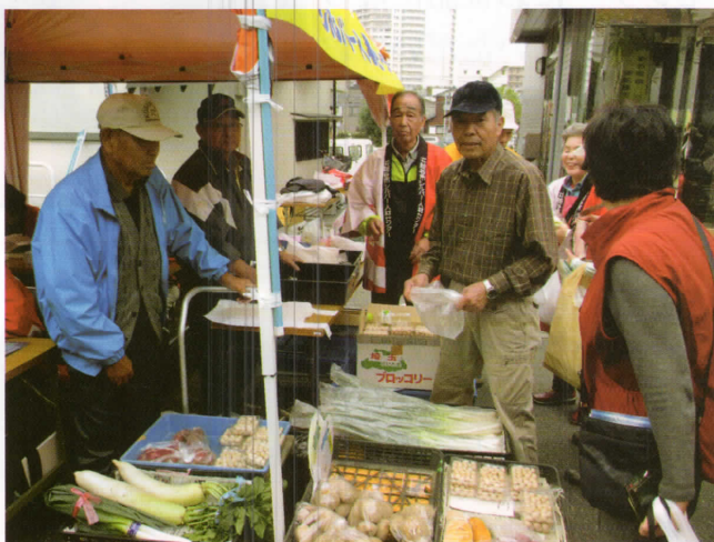
野菜楽旨味クラブによる野菜販売

ブーステント内では、人気の「野菜販売」やサービス価格の「ジュース販売」、熨斗袋の「名入れ代筆サービス」、テント前では、ポケットティッシュ付「サービスメニュー」の配布等、市民にPRを行ないました。