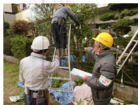
安全管理委員による安全パトロール

また、体調管理も安全のための大切な要因です。自分の体力を過信せず、常に健康の維持に努めていただくよう併せてお願いいたします。