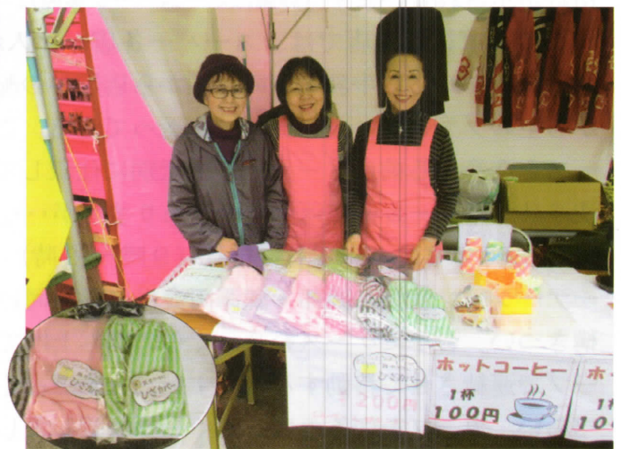
コーヒー、ひざカバー販売