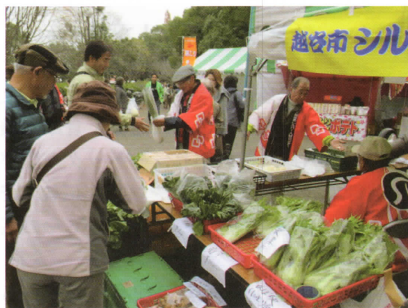
今年も大盛況の野菜販売

ホットコーヒーの販売は、残念ながら昨年度以上の売り上げとはならなかったものの大変好評をいただき、初出品の会員手作りのひざカバーは、全て売切れました。