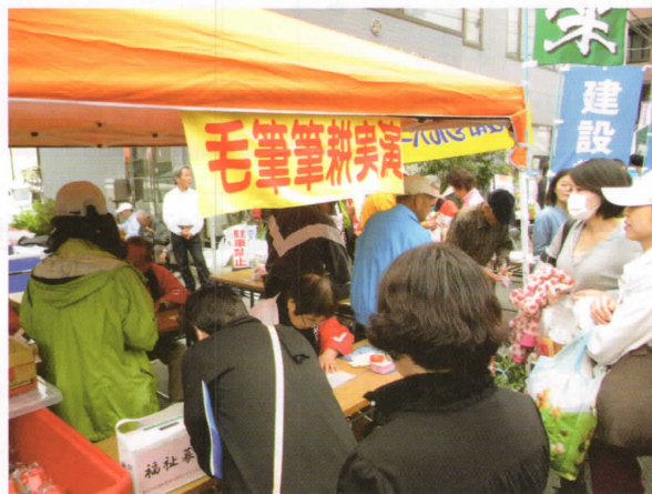
筆耕班による実演サービス

今年も、盛りあがった市民まつりでした。パレードに参加して頂いた会員の皆様、ありがとうございました。